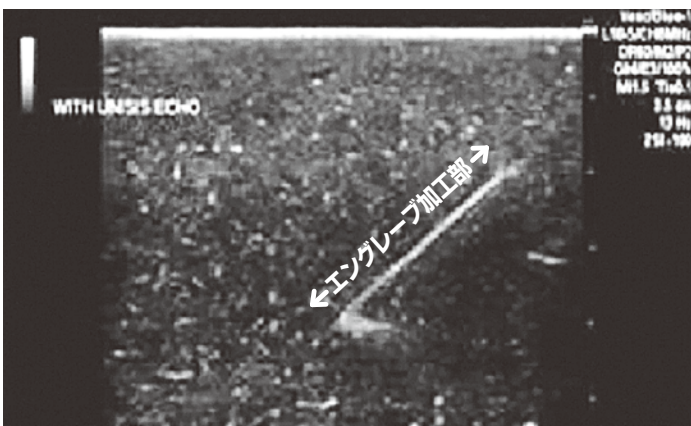
協力：富士フイルム FAZONE シリーズ エコー針の反射による白陰画像