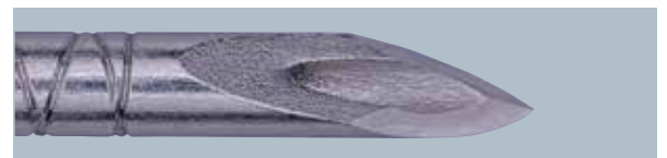
ランセットポイント(斜めから)