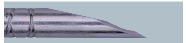
ランセットポイント(横から)

針先は切れ味の良いランセットポイントを採用。エングレーブ加工を施してありながら、滑らかに加工されている針先は、動物の皮膚に対して抵抗がなくスムーズな穿刺を実感できます。先端にシリコンオイルを塗布することにより、皮膚の硬い動物へのスムーズな穿刺をサポートします。